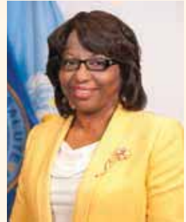
Dra. Carissa F. Etienne Directora

Este documento representa el primer esfuerzo para apoyar la puesta en práctica de los Objetivos de Desarrollo Sostenible, especialmente del ODS 3. Tiene por objeto facilitar el diálogo intersectorial y preparar a la Región de las Américas para la puesta en marcha